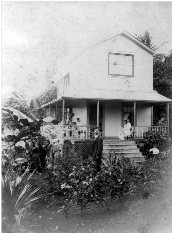
ハワイ(ヒロ)の家 庭に宇吉師、三輪車に乗っているのが諦一 ベランダにいるのがフジと敬二