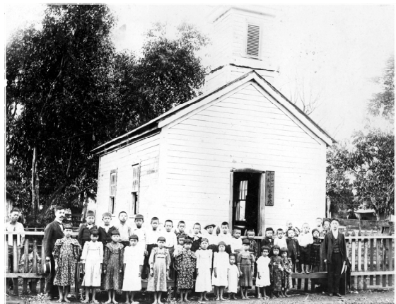
ワイケア日本人小学校