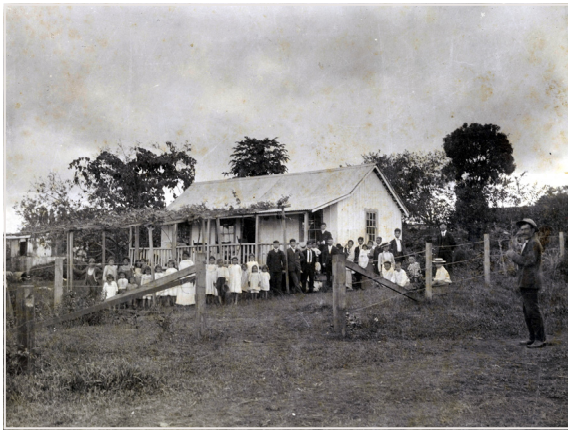
1905年(明治38年)7月8日 ハワイ・パパイコウでの仮住まい パパイコウはヒロより少し北にある小さな町